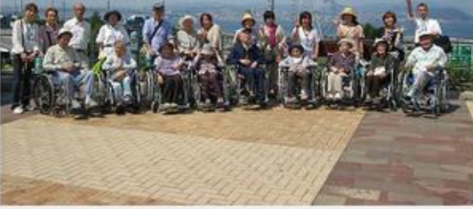
淡路ハイウェイオアシスにて