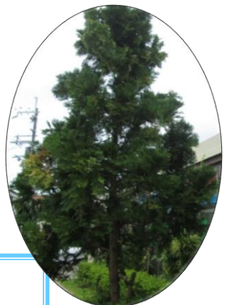
翌檜(あすなる) の木

楽しかった一日もあっという間に終わってしま いました。ご利用者さまはもちろん、家族の方々にも 喜んでいただくことができたと思っています。 みなさんのご協力に心より感謝申し上げます。